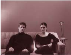
Myriam Yates L'invitation , 1999 Installation photographique, 122 cm x 183 cm, 101,6 cm x 52,4 cm

Le travail photographique de Myriam Yates questionne l'appropriation des images et leur circulation dans différents outils de communication. La facilité par laquelle nous pouvons choisir des images, les télécharger et les conserver dans des fichiers nous rend presque insensibles à la propriété artistique. Nous photocopions et numérisons des images sans trop nous soucier de l'origine de celles-ci. La recherche photographique de Myriam Yates repose sur cette exploration.