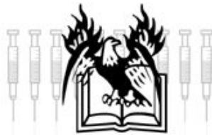
Yan Breuleux Histoire sans fin (Never ending (hi) story) , 2000 Installation multimédia, 152,5 cm x 122 cm x 244 cm

Conçue comme un poste de travail, l'installation cache un ordinateur derrière une cloison et deux moniteurs téléés disposés sur des socles. Ce dispositif permet à l'artiste de proposer un programme interactif et d'inverser les rôles en laissant les commandes au visiteur. Assis devant l'écran de l'ordinateur, il peut expérimenter la performance du vidéojockey simplement en enfonçant les touches du clavier. Le visiteur crée alors sa propre animation au son d'une musique techno. Histoires sans fin est, de prime abord, une œuvre amusante et ludique qui cache cependant une certaine critique de notre société. Chaque icône, en tant que symbole chargé de sens, nous fait réfléchir sur l'influence de la culture américaine et ses valeurs mercantiles.